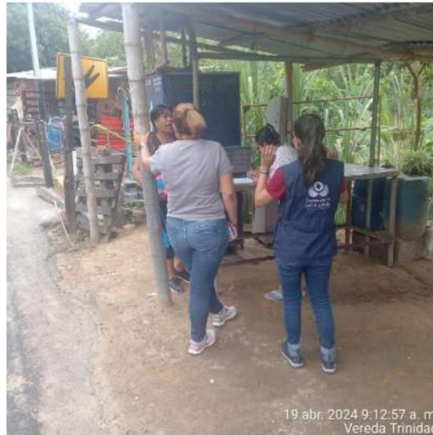
Imagen 5: Diálogo con la Comunidad de Trinidad

11. El 22 de enero de 2024, mediante oficio institucional No. 20240060020214831, la Defensoría del Pueblo solicitó información a EMPRESAS PÚBLICAS DE MEDELLÍN -EPM- sobre la falta de acceso al servicio público domiciliario de energía por parte de la comunidad de la Vereda Trinidad. Posteriormente el 18 de marzo del mismo año, se reiteró el requerimiento mediante oficio No. 20240060021607401.