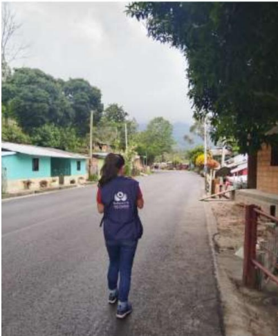
Imagen 4: Recorrido de la Vereda Trinidad

10. La verificación en terreno permitió constatar que, aunque algunas viviendas cuentan con cobertura de servicios públicos, otras —ubicadas en condiciones similares— han sido excluidas del acceso al servicio de energía eléctrica. Esta situación genera una evidente desigualdad, vulnera el principio de igualdad en el acceso a servicios públicos esenciales y refleja la existencia de obstáculos administrativos por parte de EPM y de las demás entidades competentes para garantizar dicho servicio a veintidós (22) familias de la Vereda Trinidad, en detrimento del bienestar de parte de sus 305 habitantes.