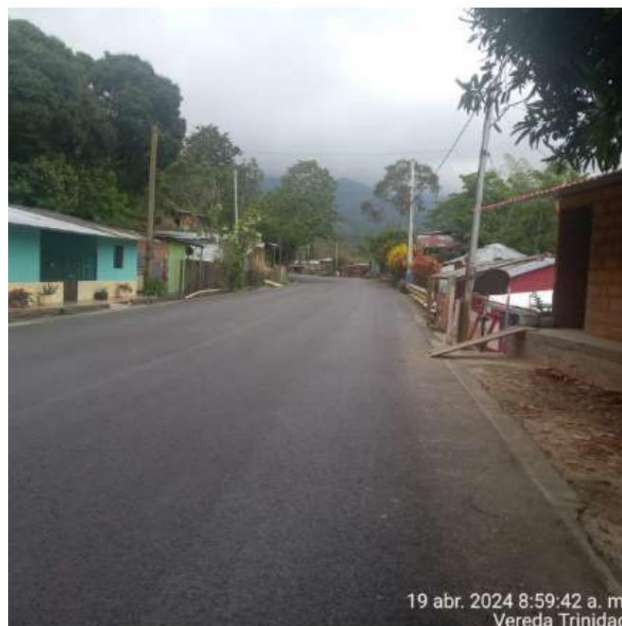
Imagen 1: Vereda Trinidad

5. Sin embargo, se evidenció que otras viviendas, intercaladas entre las que sí tienen acceso a dichos servicios, no cuentan con conexión a redes de energía eléctrica ni otros servicios públicos, situación que genera una notoria desigualdad en las condiciones de vida de las familias afectadas.