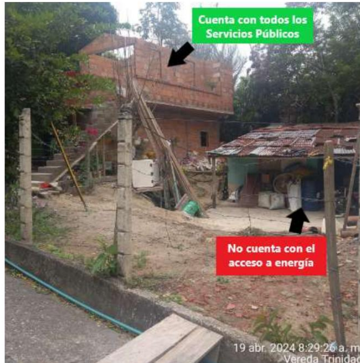
Imagen 2: Viviendas a la misma distancia a borde de carretera

6. En dialogo con algunos habitantes del sector, estos manifestaron que llevan más de diez (10) años asentados en la vereda sin contar con acceso al servicio de energía eléctrica, a pesar de que sus viviendas se encuentran ubicadas a la misma distancia del borde de la vía que otras viviendas colindantes, las cuales, sí disponen de todos los servicios públicos, incluyendo el suministro de energía eléctrica.