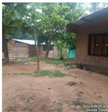
Imagen 3: Viviendas en material de construcción y en madera

8. La comunidad señaló que han presentado, de manera individual, múltiples solicitudes de conexión al servicio de energía eléctrica. Sin embargo, EPM ha rechazado dichas solicitudes, argumentando que las viviendas no cumplen con las distancias mínimas o no respetan las fajas de terreno exigidas con respecto a la vía nacional.